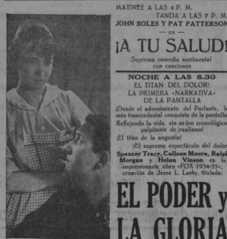
Spencer Tracy and Colleen Moore are featured in Jesse L. Lasky's latest production for Fox Film, "The Power and the Glory."